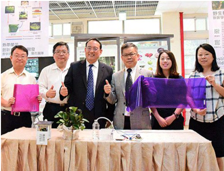
強化產學連結邁向科技農業新里程

國立屏東科技大學 National Pingtung University of Science and Technology