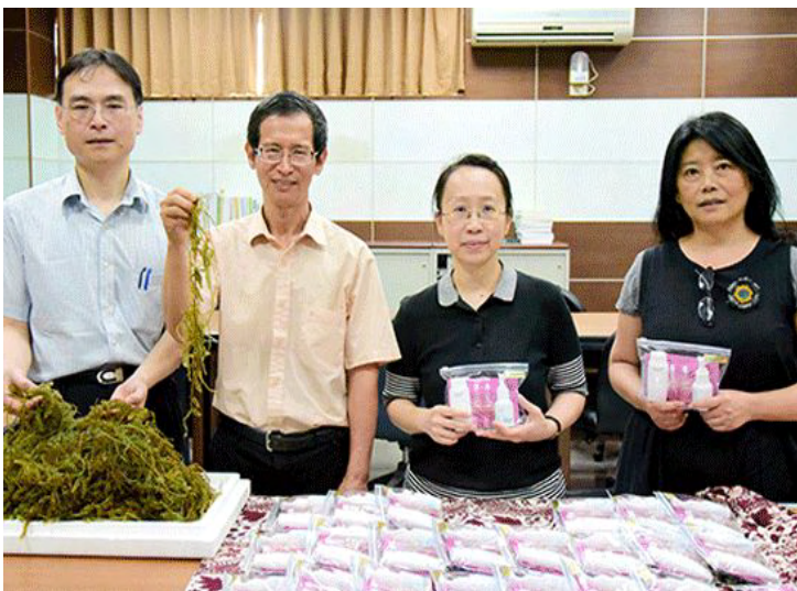
葡萄復育+生技美妝開創新價值