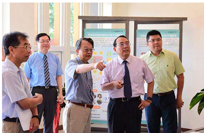
屏科大與臺科大合校雙邊會談