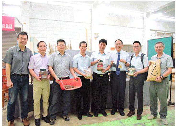
農林副資材循環利用創值開發中心啟用典禮