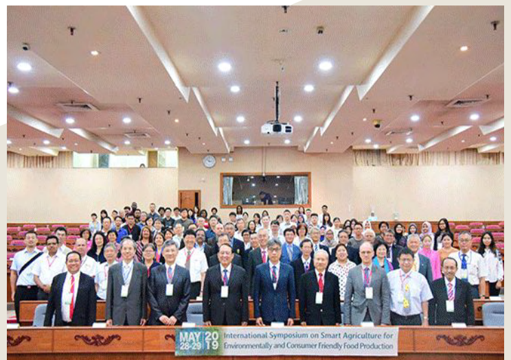
智慧農業應用於環境友善及消費者導向之糧食生產國際研討會